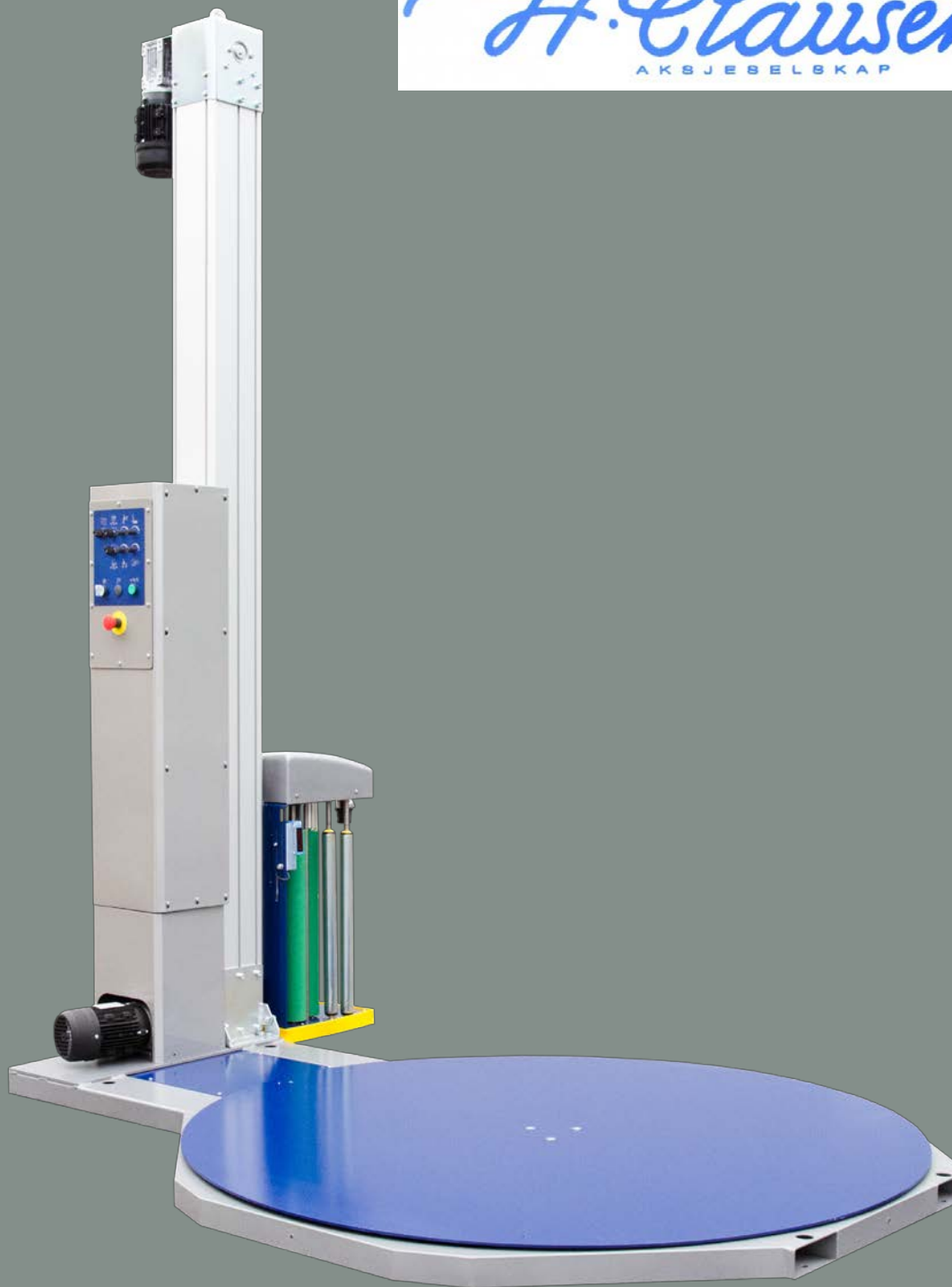
Streckfilmmaskin CTT 215