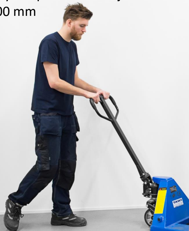
Støtteben for optimal stabilitet