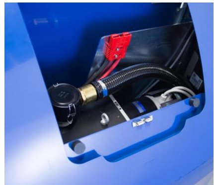
Integret pumpe og batteri